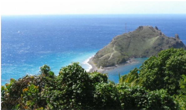
Utsikt över Scotts Head.